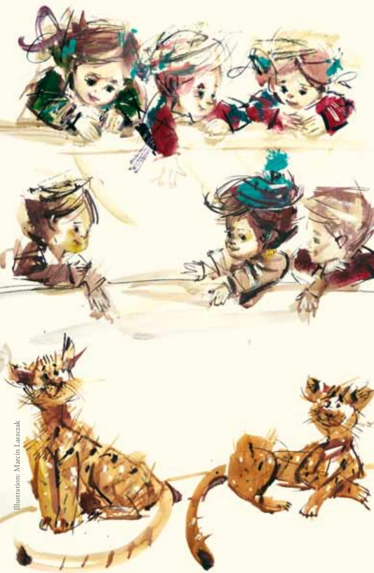
Illustration: Marcin Laszczak